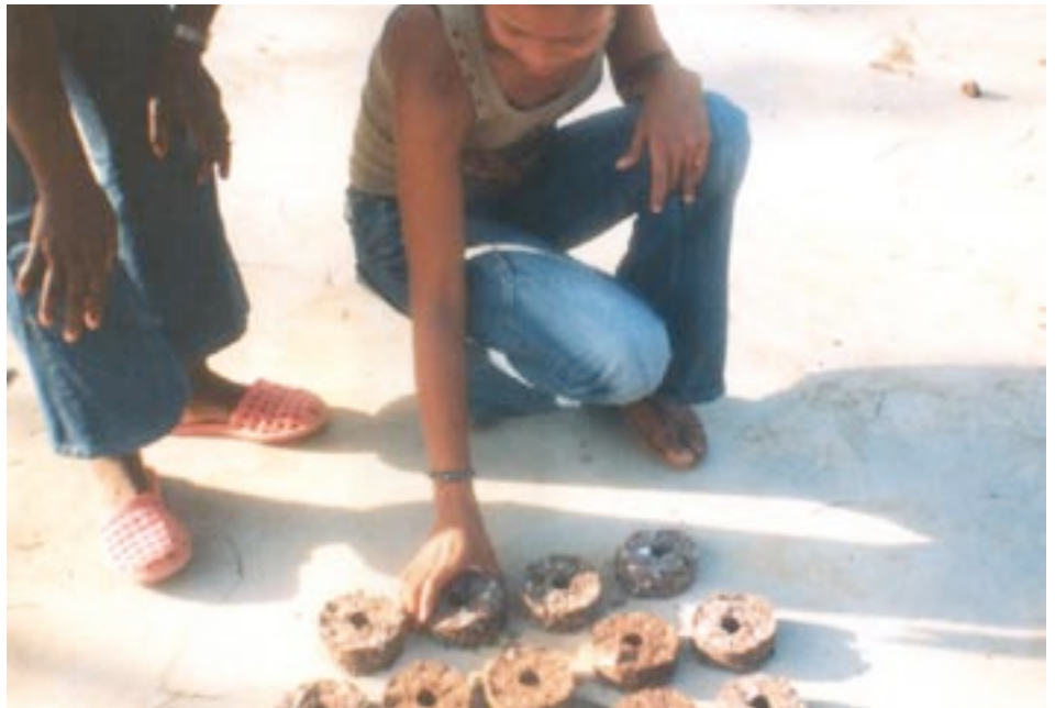
Les femmes fabriquent plusieurs types de briquettes afin d'en tester la résistance et les font sécher au soleil.

Afin de pouvoir cuisiner, les paysans continuent à couper du bois et à le transformer en charbon. Ils vendent les surplus en ville pour survivre, malgré la loi qui interdit la coupe des arbres. Ce cercle vicieux de la déforestation engendre de graves conséquences pour l'agriculture et la pêche : faute de racines, les sols ne tiennent plus, s'érodent et deviennent incultivables. La pluie se transforme en menace, des torrents de boue dévalent des collines, détruisent les récoltes, se déversent dans les rivières et causent la mort des poissons. Ce sont 15 millions de mètres cube de terres cultivables qui se perdent par an à cause de l'érosion. Le MPP a décidé de réagir, notamment en formant la population à la gestion et à la protection de l'environnement, à l'exploitation rationnelle des ressources naturelles, à l'importance des arbres dans l'écosystème, aux impacts du déboisement sur l'érosion des sols,