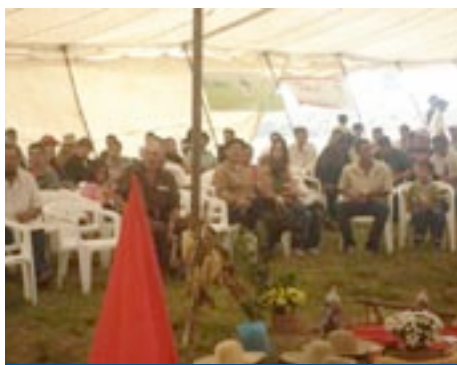
Débats organisés pour la 4 ème rencontre nationale du réseau BioNatur.