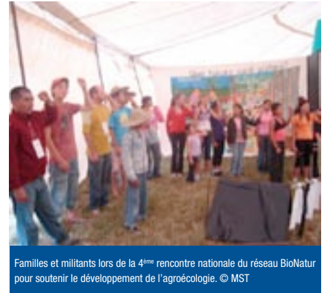
Familles et militants lors de la 4 ème rencontre nationale du réseau BioNatur pour soutenir le développement de l'agroécologie.

Les deux jours de la rencontre nationale du réseau ont été consacrés à la stratégie d'organisation de la production et de l'accès aux marchés, à la formation technique de l'ensemble des familles productrices de Bionatur, et aux défis qu'impose l'agro-