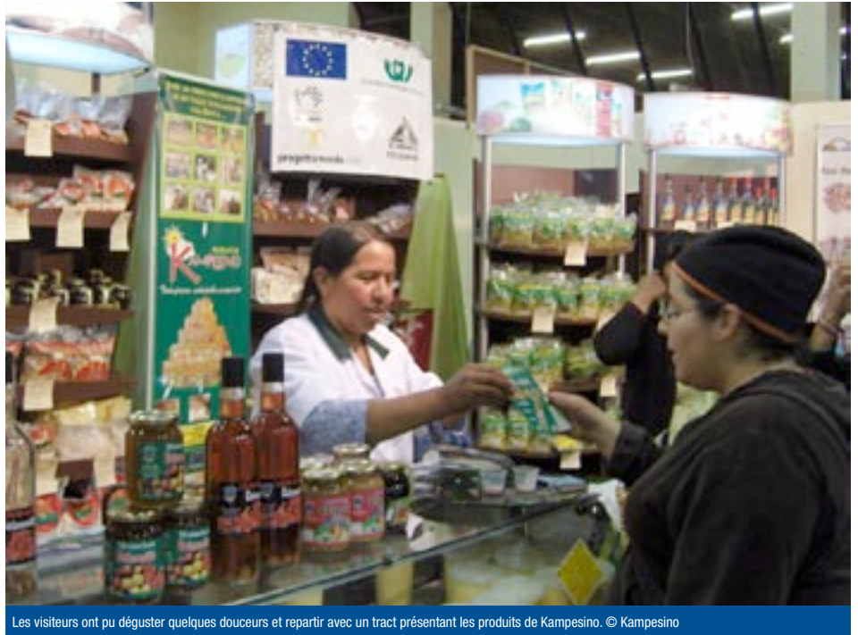
Les visiteurs ont pu déguster quelques douceurs et repartir avec un tract présentant les produits de Kampesino.

Feicobol, qui est la deuxième plus grande feria de Bolivie, a accueilli une fois de plus de nombreuses organisations allant des grandes entreprises latino-américaines et étrangères aux petits artisans et producteurs des communautés villageoises. Ces derniers ont eu l'occasion de s'ouvrir à de nouveaux marchés : les producteurs des communautés paysannes de la province de Tapacari dans le département de Cochabamba ont ainsi pu exposer les avantages de leurs produits – tavelure, quinoa, cañahua – aux entreprises boliviennes et étrangères lors des « rendez-vous commerciaux ». Mais en plus de présenter leurs produits, la feria a aussi été l'occasion, pour les producteurs communautaires, de dire leur engagement pour une agriculture durable au sein des organisations économiques paysannes, et de sensibiliser les visiteurs à la dimension éthique de la production. Parmi d'autres, l'association Kampesino 2 , qui assure la transformation et la commercialisation des produits des paysans de la région de Cochabamba, était présente à la feria.