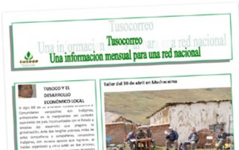
Premier numéro de Tusocorreo, juin 2008.

Recueillir la parole des communautés villageoises et assurer le lien entre celles-ci. Tusoco, réseau d'associations paysannes pour un tourisme solidaire 1 , a relevé le défi en publiant le premier numéro du bulletin d'information Tusocorreo, qui a vu le jour en juin 2008. L'affaire n'est pas simple : comment rapporter la parole des communautés enclavées dans les hauteurs de l'Altiplano bolivien, loin des câbles téléphoniques, antennes relais et connexions Internet ? La réponse de Tusoco est pour le moins originale, elle repose sur une chaîne humaine de transmission de l'information. L'aventure débute à Cochabamba, dans le centre de la Bolivie, quand une missive est confiée à un chauffeur de bus provincial qui la remet quelques centaines de kilomètres plus loin à un transporteur de nourriture, qui fait partie des seules personnes à se rendre dans les régions les plus reculées de l'Altiplano. Le transporteur, moyennant 5 bolivianos (environ 45 centimes d'euro), transporte et remet la missive au chef du village ou à un représentant d'une organisation paysanne. La plupart des villageois n'ayant jamais appris ni à écrire ni à lire, chaque communauté désigne une personne qui lit la missive lors d'une