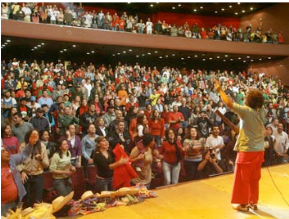
Concert de Chico Cesar, star au Brésil, venu soutenir les manifestations culturelles organisées par le MST et la Via Campesina.

1 Via Campesina : mouvement international de lutte pour l'agriculture paysanne www.viacampesina.org / 2 Voir « Quand le MST se forme pour mieux informer », Résonances n°19, décembre 2007